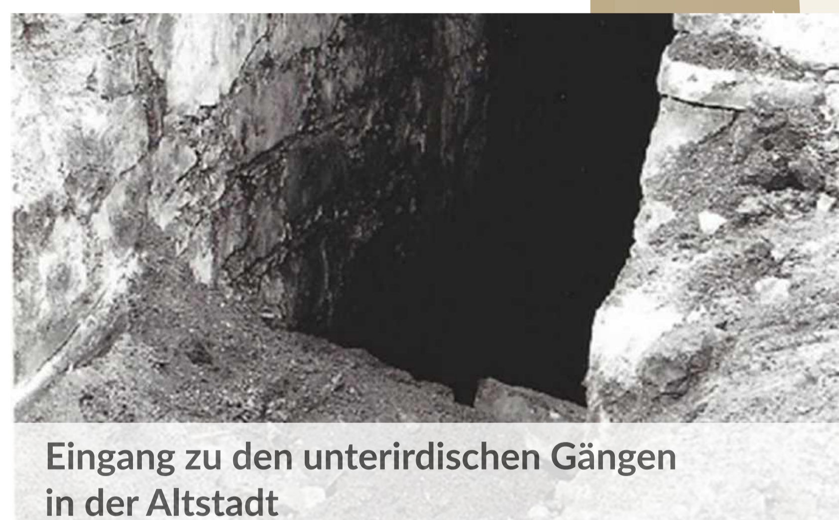
Eingang zu den unterirdischen Gängen in der Altstadt