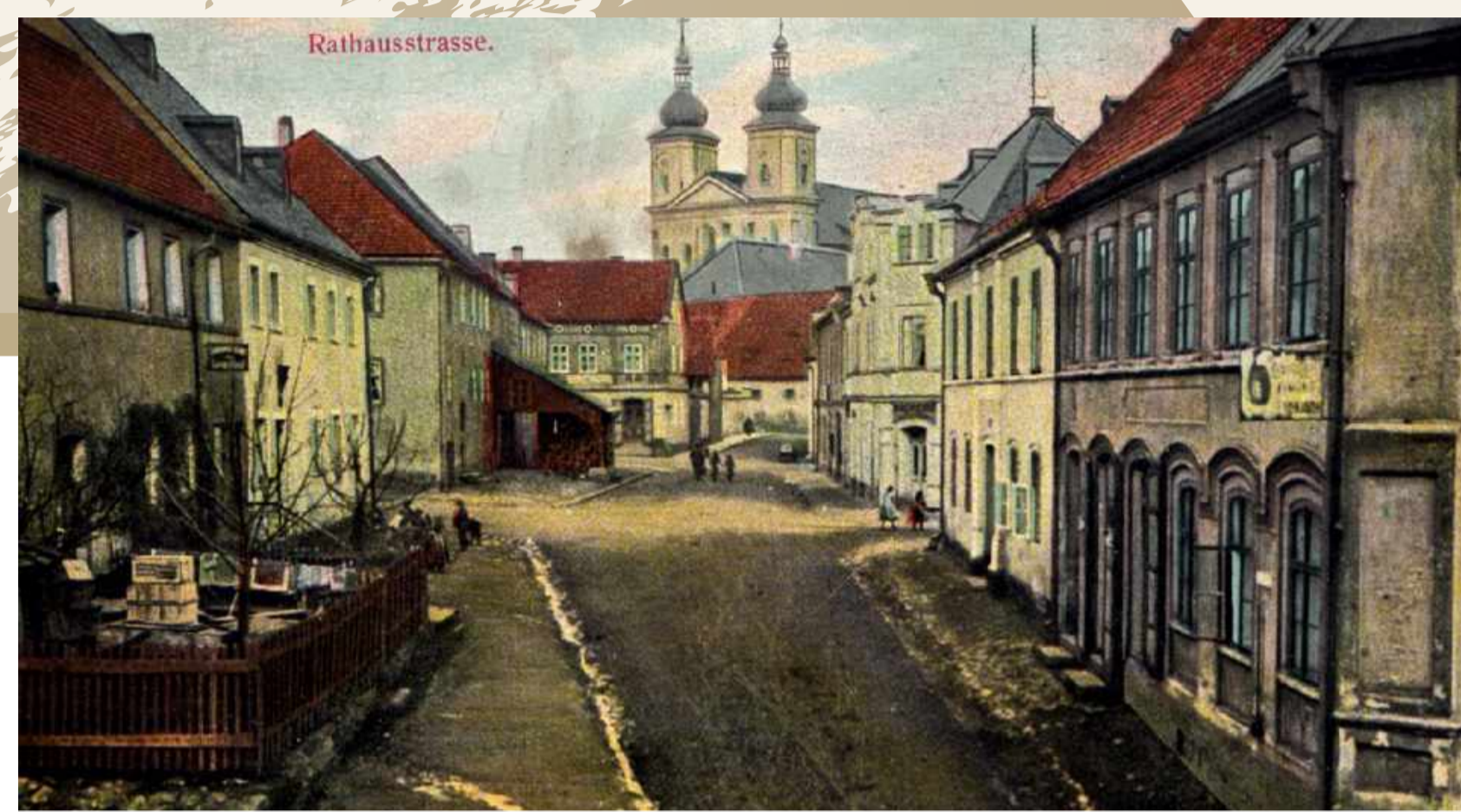
Rathaus - Museumsstraße um 1910

Habt ihr gewusst, dass bei mir auch mal Feuerlöschgeräte, das erste Waldsassener Krankenhaus, eine Flüchtlingsunterkunft und die Stadtbücherei untergebracht waren?