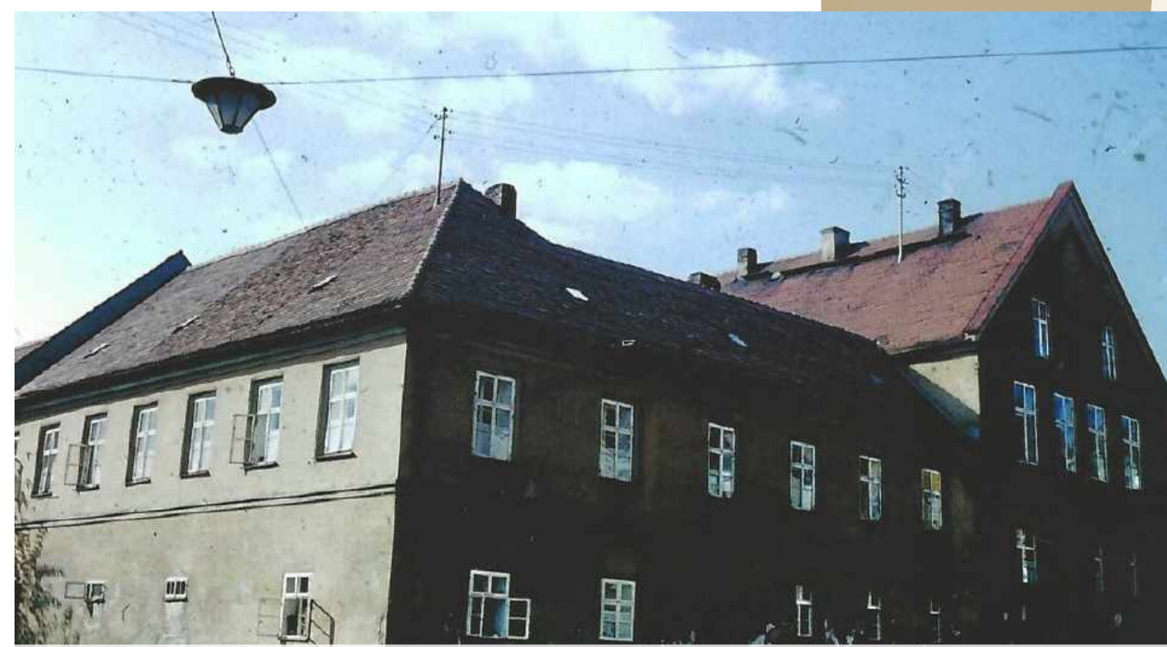
Altes Rathaus, Rückansicht