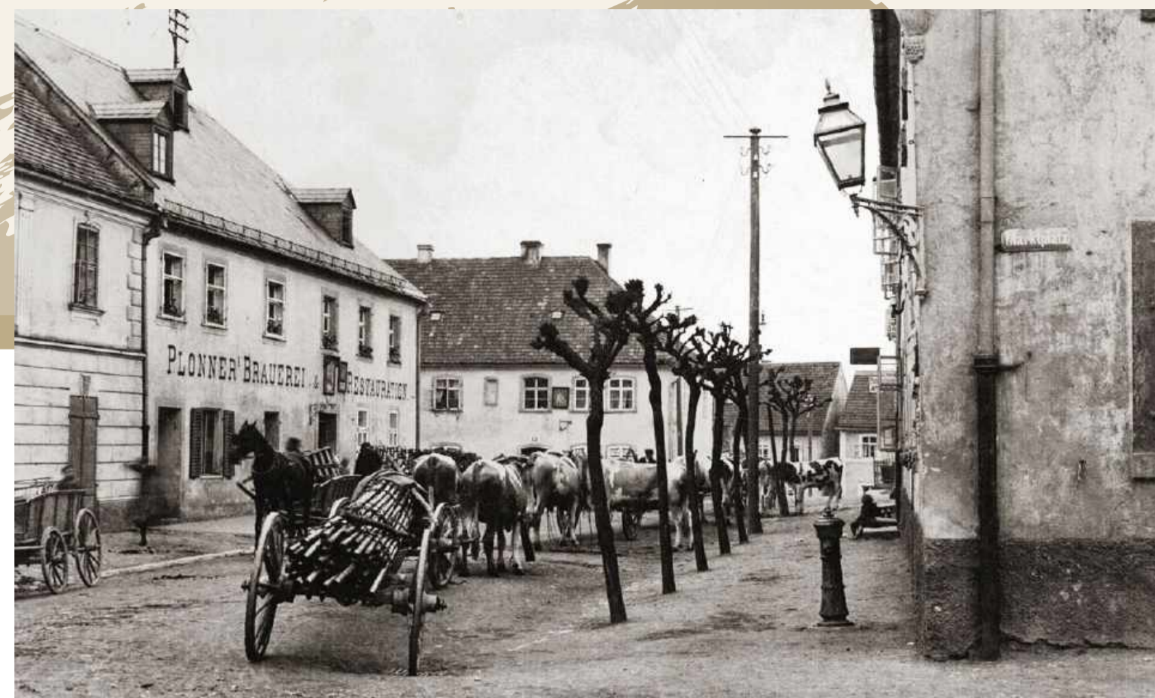
Ansicht um 1912

Danach hatte ich immer wieder neue Läden im Haus: Es gab bei mir Fische zu kaufen, später Milch und danach Getränke!