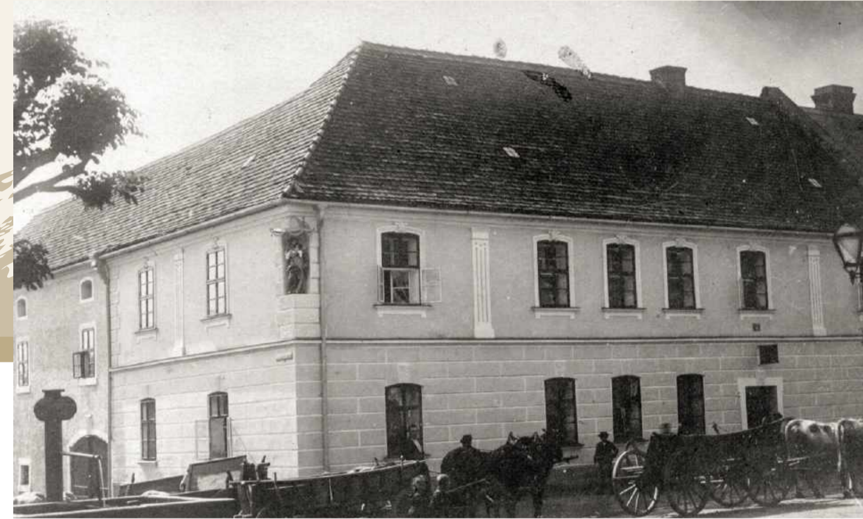
Hausansicht mit Rohrbrunnen, um 1910

Diese gibt es nicht mehr, aber das Hotel kann in diesem Jahr 70jhriges Jubilum feiern!