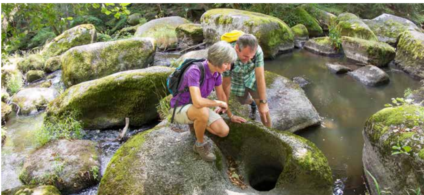
Waldnaabtal an der Gletschermühle