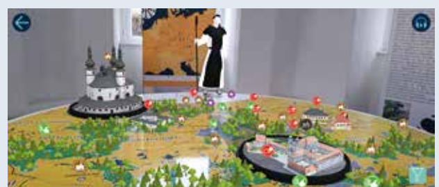
Einstiegsportal zum Weg der Zisterzienser Nähe Stiftsbasilika Waldsassen • interaktives Landschaftsmodell zur Klosterlandschaft im Pavillon des Abtschlusses