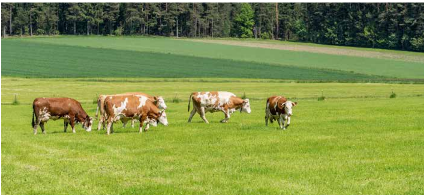
Kühe auf der Weide