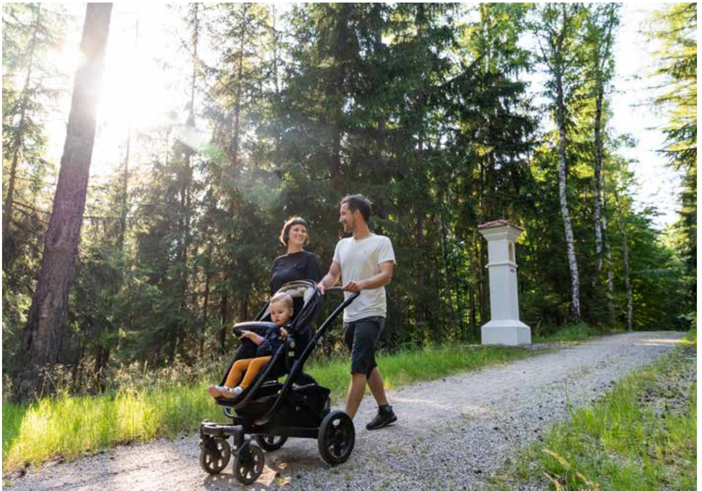
Stationsweg in Waldsassen