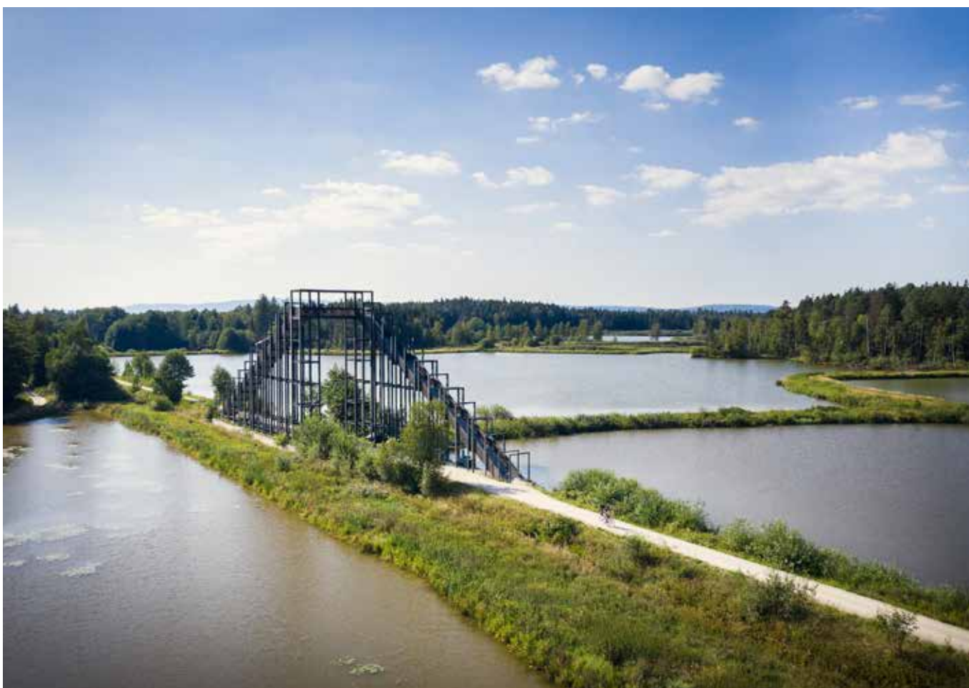
Himmelsleiter in der Tirschenreuther Teichpfanne